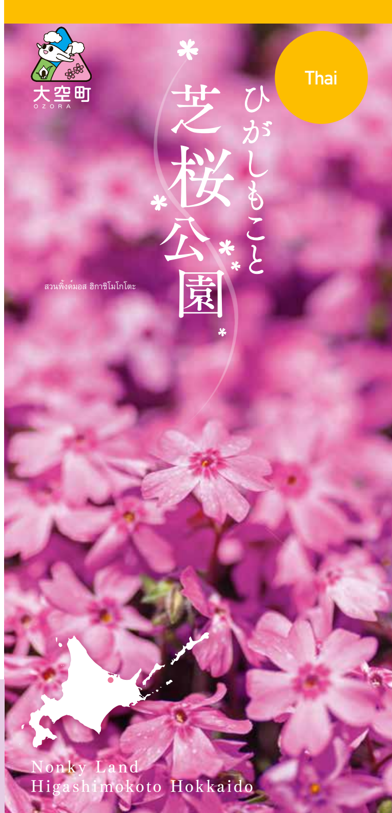
สวนพืชมอส อิกาชิมโโกโตะ